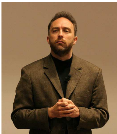
Jimmy Wales, fondateur de Wikipédia