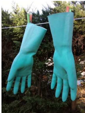
Portrait de gants cyan (ou Klein, selon la lumière)