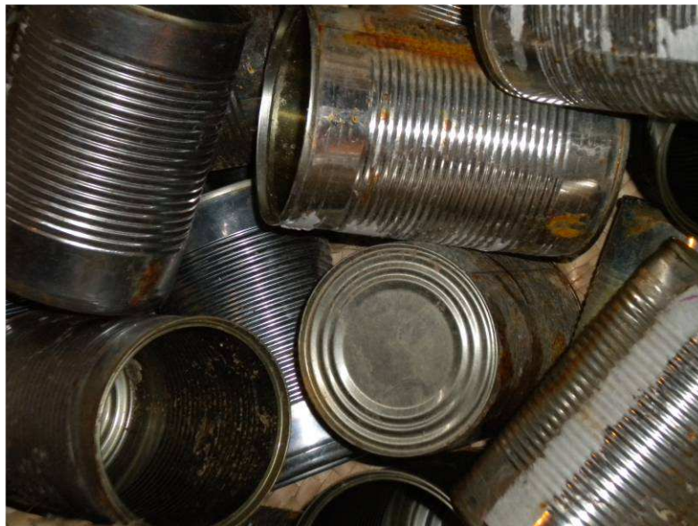
Portrait de la matière de Base du MURMUR