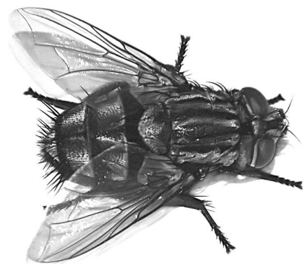
Portrait de Sarcophaga Carnaria

Ainsi vont les choses, dans la vie, lorsque se répandent en quinconce les attributs sonores de la poétique immatérielle.