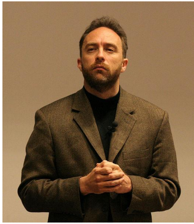
Jimmy Wales, fondateur de Wikipédia