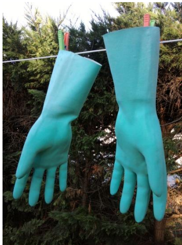
Portrait de gants cyan (ou Klein, selon la lumière)