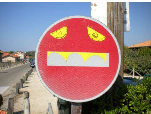
...sans interdits crédibles