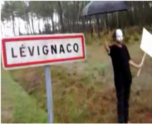
L'entrée de la Base secrète de Lévignacq dans les Landes Cf. Apostille 4 « Apocryphe » - Système 1 – Paul Pignon www.ladam.eu