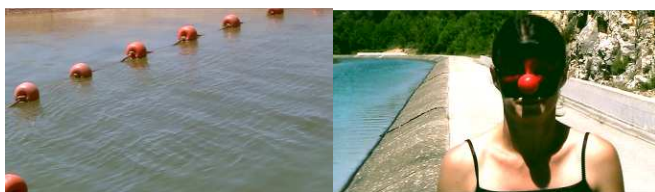
Tous les clowns se cachent dans les canaux historiques