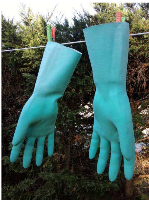
Portrait de gants cyan

C'est la phrase qu'Angel Michaud n'a pas osé écrire. Je vous la livre ainsi que l'image qui a inspiré l'auteur. Non pas que cela soit tellement important, finalement ; d'autant plus que traire des gants n'a rien de raisonnable ni d'utile. En effet, qu'ont en commun un gant et un pis ? Les vaches possèdent deux paires de mamelles qui sont inguinales alors que les gants sont à l'aine ce que les pieds sont aux genoux et que les gants de laine ne siéent guère aux gnous.