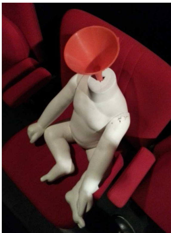
Sébastien GORTEAU en scène